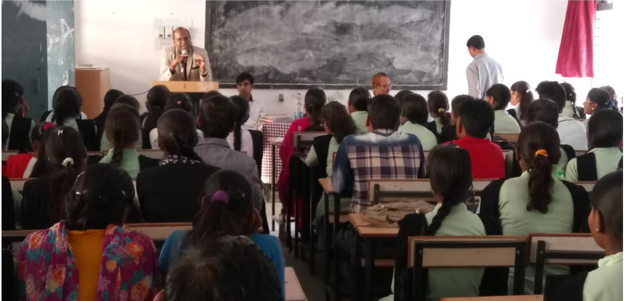
Competition Exam Vyakhyan 9 Dec. 2017