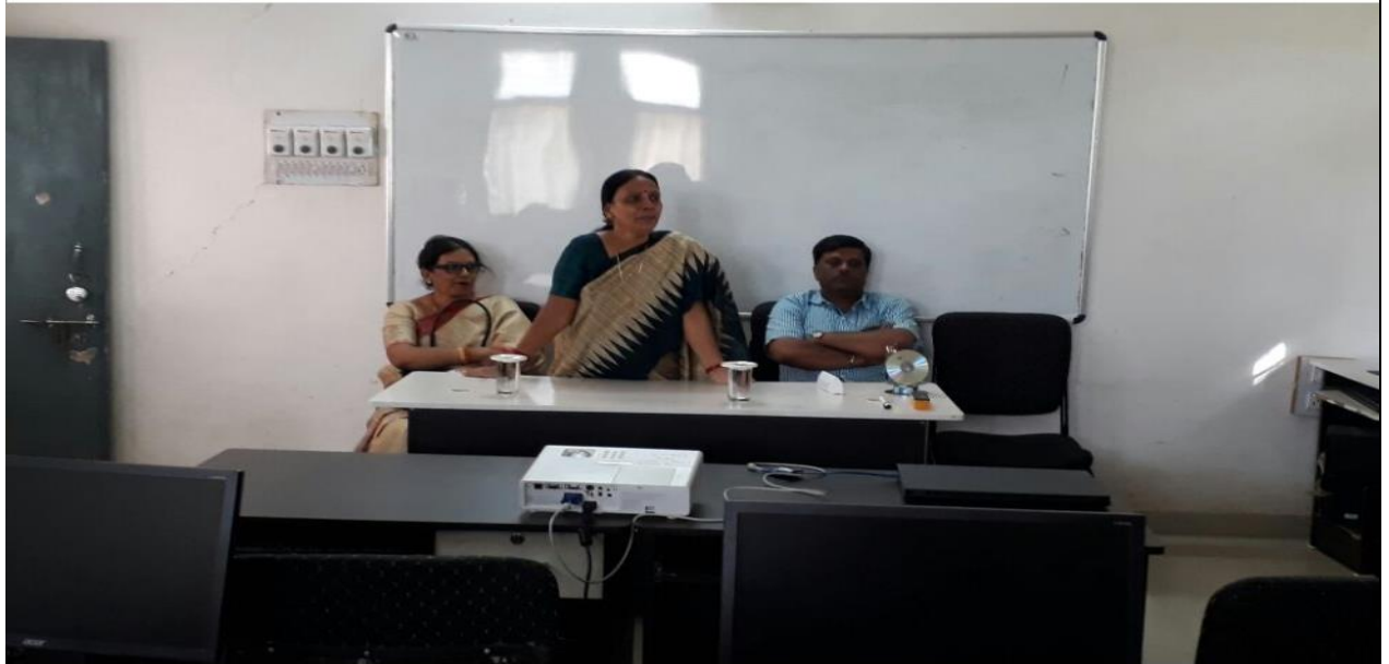
One Day Seminar For NAAC