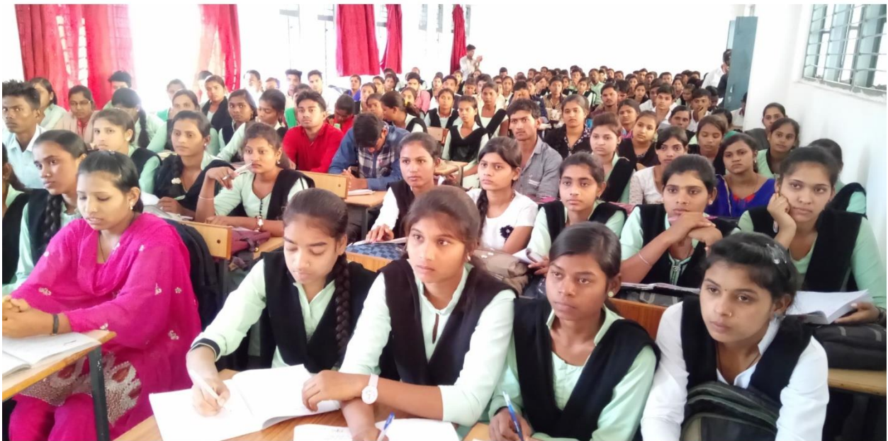
Competition Exam Vyakhyan 9 Dec. 2017